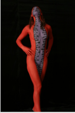
Paint & Photo by Bernhard Witsch

Am Freitag gilt es beim Themenbereich „Casino“, mit Kreativität und Phantasie alles rund ums Spiel im Casino in Szene zu setzen. Beim Catwalk der Models durch das Casino können die lebenden „Kunstwerke“ auch von der Nähe betrachtet werden, bevor diese von der Jury bewertet werden.