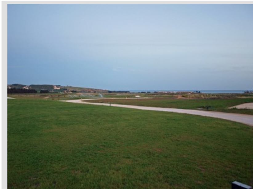
Das Verdura Golf & Spa Resort auf Sizilien.