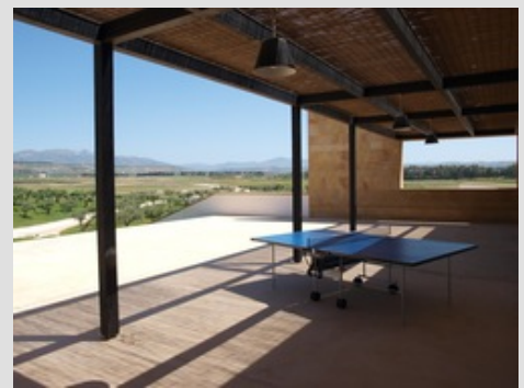
Tischtennis, Billard und Co. gehören zur Ausstattung des Trainingslagers in Sciacca auf Sizilien.

Sciacca (Sizilien)/Berlin/Coesfeld. Der WM 2010-Countdown hat begonnen, denn seit vergangener Woche Freitag bereitet sich die deutsche Fußballnationalmannschaft in Sizilien auf die WM in Südafrika vor. Auch wenn die traumhafte Urlaubskulisse und das schöne Wetter auf der italienischen Sonneninsel eher zum Relaxen einladen, wartet auf die Nationalmannschaft ein umfassendes und hartes Trainingsprogramm. Damit ist klar: Die Vorbereitung auf die Weltmeisterschaft 2010 ist in ihre entscheidende letzte Phase getreten. Zwar treten die deutschen Fußballer erst am 15. Juni erstmalig in Südafrika an, doch bis dahin muss Bundestrainer Joachim Löw noch ein schlagfestes Team formen.