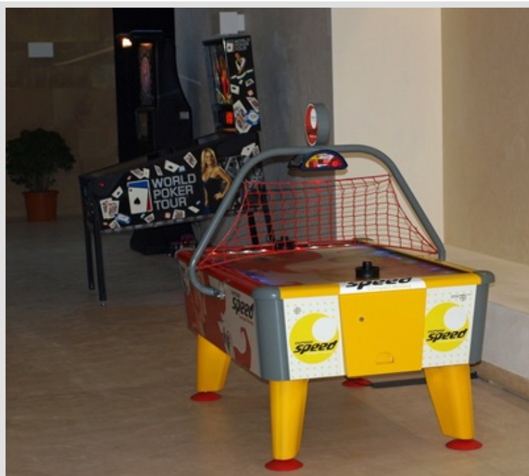
Dart, Flipper oder Air Hockey: Vielseitigkeit pur

Auf der Homepage des DFB ( http://tv.dfb.de ) ist im Beitrag „Tag 3 auf Sizilien“ das kleine Entertainment Center im Hotel zu sehen.