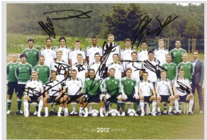
Innenansicht der Karte.