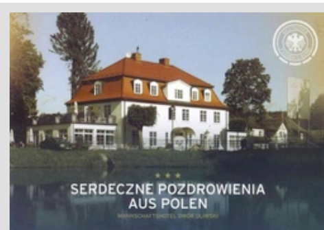
„Serdeczne Pozdrowienia“ aus Polen.

Danzig/Coesfeld. Mit „Serdeczne Pozdrowienia“ (Schönen Grüßen) aus Polen bedankte sich kürzlich die deutsche Fußball-Nationalmannschaft aus dem Mannschaftsquartier „Dwór Oliwski“ in Danzig bei der Schmidt Gruppe und bei Bally Wulff für die tolle Unterstützung während der Fußball-Europameisterschaft in Polen und der Ukraine.