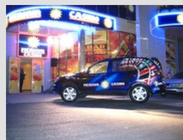
Auch in Ostrava, Tschechien, ist ein neues Merkur Casino eröffnet worden.

Neben erstklassigen Service-Angeboten und der innovativen Raumgestaltung steht den Gästen des Merkur Casinos auch hier ein internationaler Produktmix von über 56 topmodernen Spielgeräten, darunter auch 8 VLT's aus dem Hause Merkur Gaming, sowie einem elektronischen Roulette, für höchsten Spielgenuss zur Verfügung.