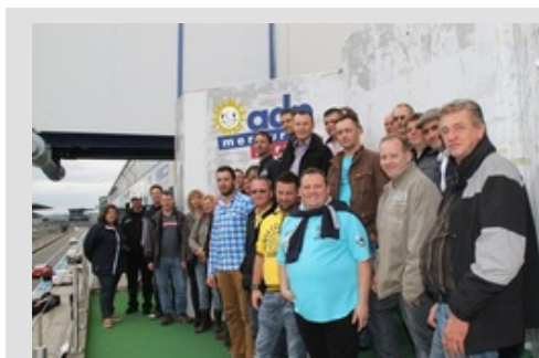
Die Teilnehmer des Sicherheitsseminars besichtigen bei ihrer Backstage-Tour über den Nürburgring auch das Siegeltreppechen.