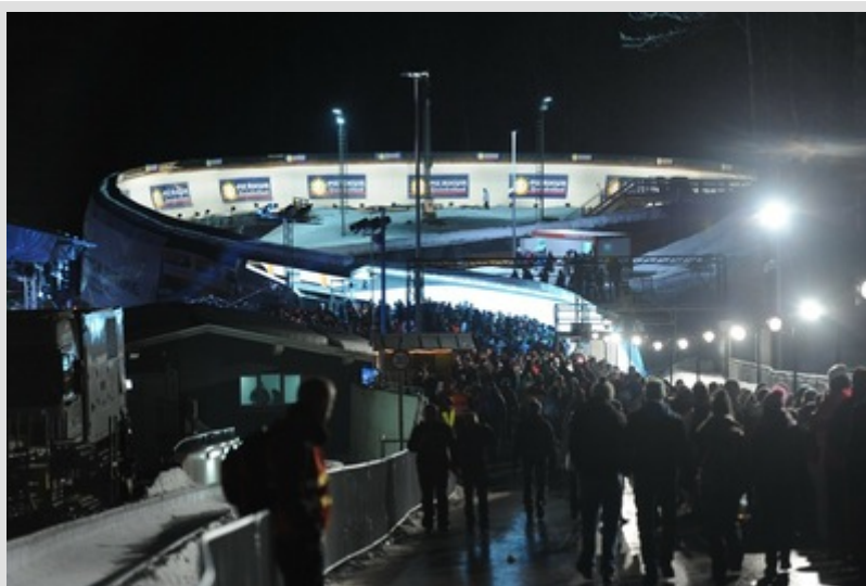
Der Merkur-Spielothek-Kreisel hatte es in sich.