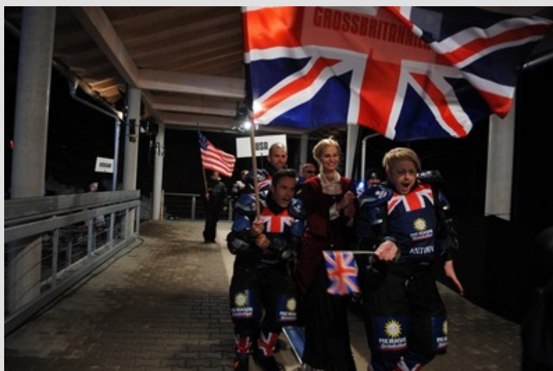
Das Team Großbritannien vertrat Merkur-Spielothek.

Auch die Quoten des Events sprachen für sich: Das Qualifying am Vorabend der WM hatte bei den 14 bis 29-jährigen Zuschauern einen Marktanteil von 13,8 Prozent, bei den 14 bis 49-jährigen waren es 12,9 Prozent. Die Wok-WM hatte am Samstag bei den 14 bis 29-Jährigen einen Marktanteil von 23,5 Prozent, bei den 14 bis 49-Jährigen waren es 17,1 Prozent. Für Freizeitvergnügen abseits der Piste sorgten die ostwestfälischen Spielemacher mit ihren Unterhaltungsspielgeräten.