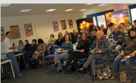
Volles Haus bei der Technik & Fun Tour: Insgesamt 1.300

Schwerpunkte der Schulung waren natürlich Tipps und Kniffe zu den neuesten Geräten und Spielsystemen der Spielemacher, darunter die Präsentation des Highlightspiels „Eye of Horus“, des Merkur Infotainment Smart-Systems, das digitale Bestellungen direkt am Gerät