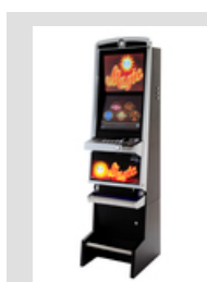
Merkur Magic Italy