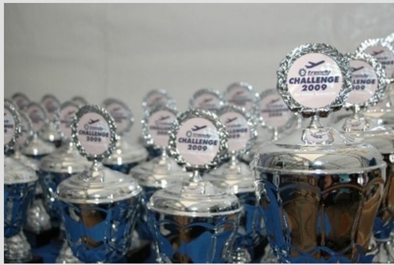
Die Siegerpokale winkten den Teilnehmern...!!!

Mehr Informationen zum Merkur Trendy und zur Merkur Trendy Challenge sind im Internet unter www.merkur-trendy.de abrufbar.