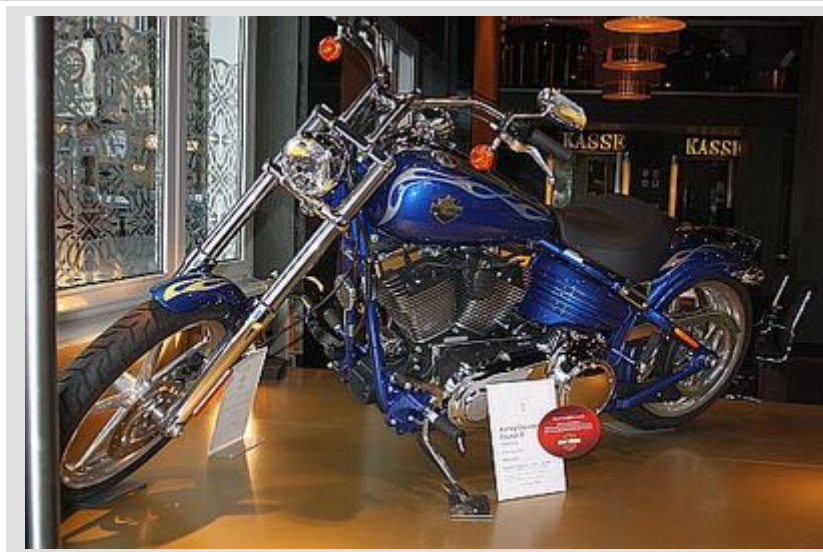
Harley Davidson Rocker C in Blau

Vorsprung durch Spieltechnik übrigens auch im Esplanade: Der Audi A4 3.0 Quattro fand seinen Fahrer. Neu vorgefahren in den Zufalls-Jackpot ist ein Silberpfeil von Mercedes. Ein rassiges CLK Cabrio bietet Spiel & Dynamik in der schönsten Form.