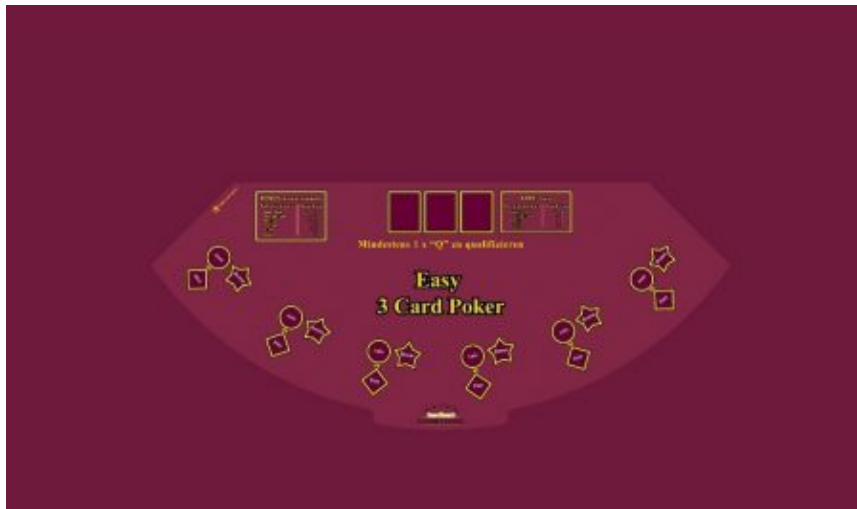
Easy 3 Card Poker Tischlayout

Besonders interessant macht Easy 3 Card Poker, dass unabhängig von den Karten des Croupiers bei diversen Kartenkombinationen Gewinne ausbezahlt werden.