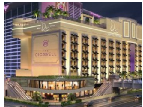
The Cromwell

Las Vegas' Hotels bieten nicht nur einen hohen Service Standard. Ein Besuch eines der zahlreichen Resorts kommt einem echten Erlebnis gleich. Weltberühmte Hotelkomplexe wie The Venetian & The Palazzo oder das MGM Grand gehören zu den größten Resorts der Welt . Ein weiterer Superlativ öffnet Besuchern in diesem Jahr seine Türen: der Las Vegas High Roller . Mit einer Höhe von 167 Metern und 28 Kabinen , die jeweils bis zu 40 Passagieren Platz bieten, ist der Las Vegas High Roller das größte Riesenrad der Welt . Er bildet das Herzstück des Linq-Komplexes , dem neuen Erlebniszentrum der