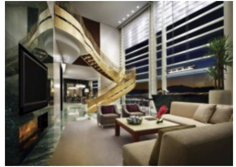
Aria – Sky Suites

Jeweils vier und fünf Forbes Sterne kann das Caesars Palace nun sein Eigen nennen. The Laurel Collection , die Luxussuiten des Hauses, wurden für ihr luxuriöses Interieur und den außergewöhnlichen Service mit vier Sternen des renommierten Forbes Travel Guide ausgezeichnet. Zum Angebot der Laurel Collection, die die Zimmer der beiden neusten Hoteltürme Augustus und Octavius umfasst, gehört ein privater Concierge , ein eigener Butler und ein rundum auf den Gast abgestimmtes Programm. Gäste der Laurel Collection by Caesars Palace genießen Zugang zum preisgekrönten Qua Baths & Spa Bereich.